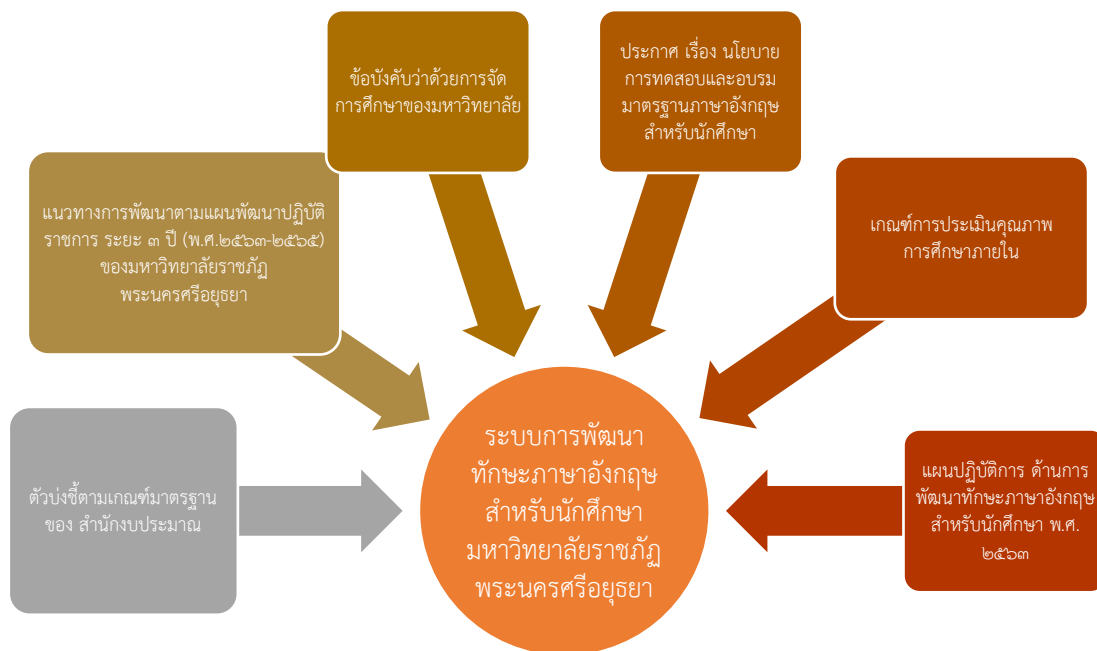
ภาพ ๑ ระบบการพัฒนาทักษะภาษาอังกฤษสำหรับนักศึกษามหาวิทยาลัยราชภัฏพระนครศรีอยุธยา